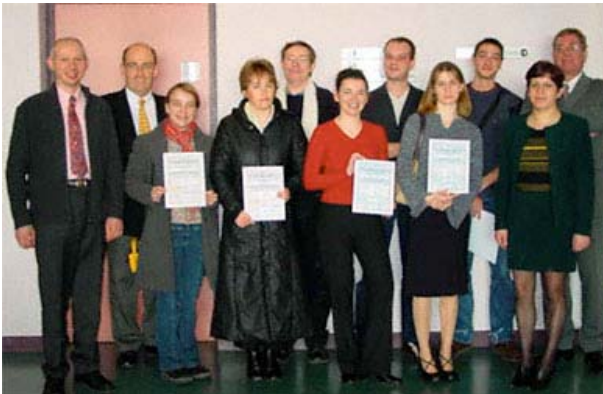
Remise des diplômes PCIE 2004